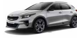
Sparklingsilber Metallic (KCS) (nicht für Xdition)