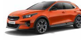
Orange Fusion Metallic (RNG) (nicht für Xdition)