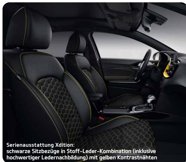
Serienausstattung Xdition: schwarze Sitzbezüge in Stoff-Leder-Kombination (inklusive hochwertiger Ledernachbildung) mit gelben Kontrastnähten