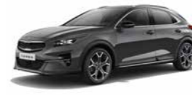
Pentametal Metallic (H8G)