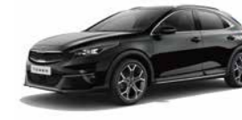
Zilinaschwarz Metallic (1K)