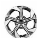
16-Zoll- Leichtmetall- felgen (für Edition 7)