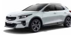
Carraraweiß (WD) (nicht für Platinum Edition)