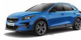
Blue Flame Metallic (B3L) (nicht für Xdition)