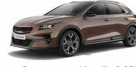
Copperstone Metallic (L2B) (nicht für Xdition)