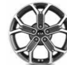
18-Zoll- Leichtmetall- felgen

Bei einigen unserer modernen Metallicfarben werden bewusst unterschiedliche Farbpigmente verwendet. Dadurch können unter bestimmten Lichtverhältnissen, z. B. direktes Sonnenlicht, attraktive Farbeffekte erzielt werden. Zum Teil kann die Farbe changieren, z. B. von Schwarz zu Dunkelblau. Bei den hier abgebildeten Farbdarstellungen kann es aufgrund der Drucktechnik zu Abweichungen zu den Originalfarben kommen. Weitere Informationen zu den Farbeffekten und Grundfarben gibt Ihnen gerne Ihr Kia-Vertragshändler. Metalllackierungen sind aufpreispflichtig.