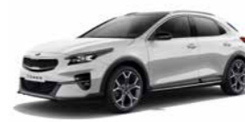
Deluxeweiß Metallic (HW2) (nicht für Edition 7)