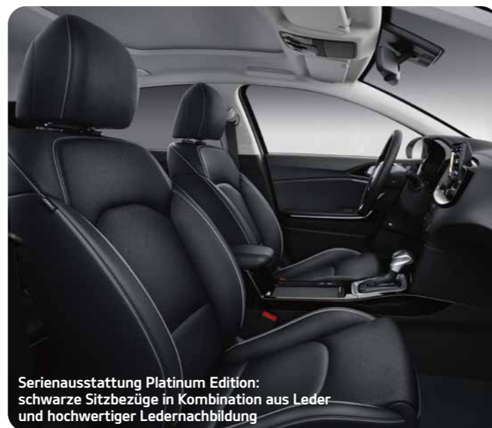
Serienausstattung Platinum Edition: schwarze Sitzbezüge in Kombination aus Leder und hochwertiger Ledernachbildung