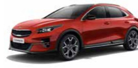
Infrarot Metallic (AA9) (nicht für Xdition)