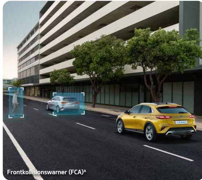
Frontkollisionswarner (FCA) A

Der Kia XCeed bietet mit seinen hochentwickelten Technologien und intelligenten Assistenzsystemen eine umfangreiche Sicherheitsausstattung auf hohem Niveau.