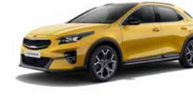
Quantumgelb Metallic (YQM)