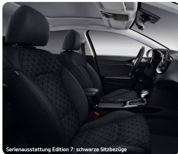
Serienausstattung Edition 7: schwarze Sitzbezüge

Das Interieur des Kia Xceed besticht durch seine stilvolle Gestaltung und die hochwertigen, sorgfältig ausgewählten Materialien. Je nach Ausführung bestehen die schwarzen Sitzbezüge entweder aus Stoff und aus Kombinationen von Stoff oder Leder mit hochwertiger Ledernachbildung. Dem Innenraum der Ausführung Xdition verleihen gelbe Farbakzente und Sitzbezüge mit Wabenmuster ein exklusives Flair.