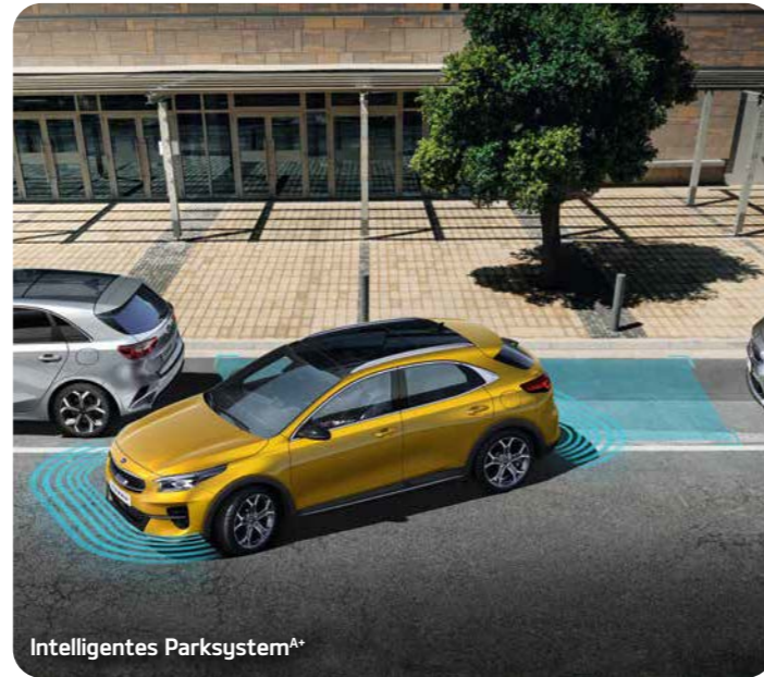
Intelligentes Parksystem A*

Der serienmäßige Müdigkeitswarner (Driver Attention Warning, DAW) analysiert ständig verschiedene Fahrzeugparameter wie die Betätigung von Lenkrad und Blinker, die Beschleunigungsmuster und die Gesamtdauer der Fahrzeit. Erkennt das System beim Fahrer Zeichen von Erschöpfung, weist es ihn durch einen Warnton und eine Anzeige in der Instrumenteneinheit darauf hin.