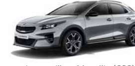
Lunarsilber Metallic (CSS) (nicht für Xdition)