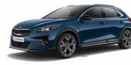
Cosmosblau Metallic (CB7) (nicht für Xdition)