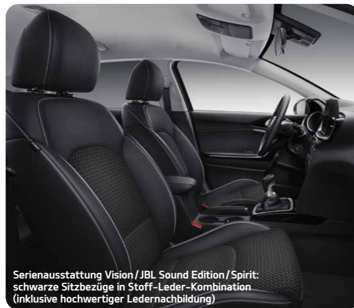
Serienausstattung Vision / JBL Sound Edition / Spirit: schwarze Sitzbezüge in Stoff-Leder-Kombination (inklusive hochwertiger Ledernachbildung)